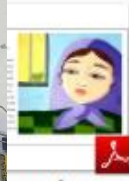
بسم الله الرحمن الرحيم.pdf